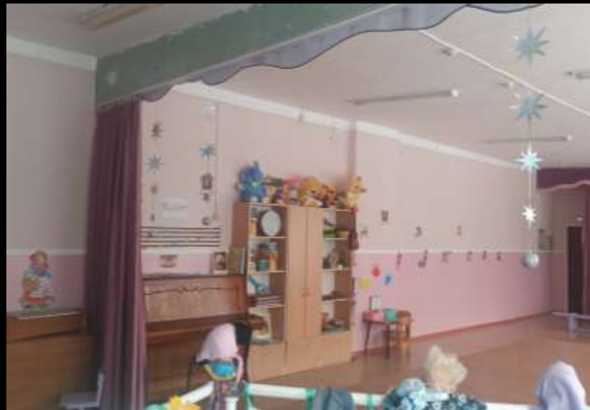
Нижняя правая точка