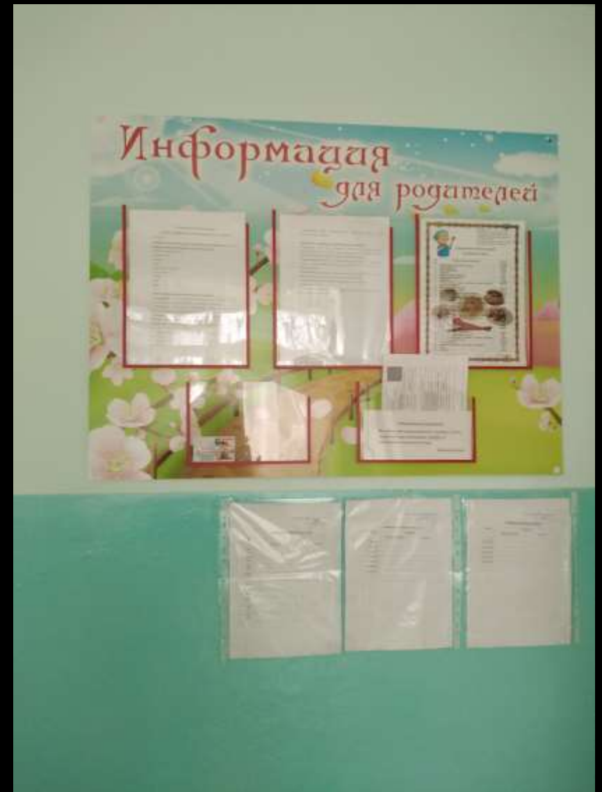
Среда для диалога с родителями