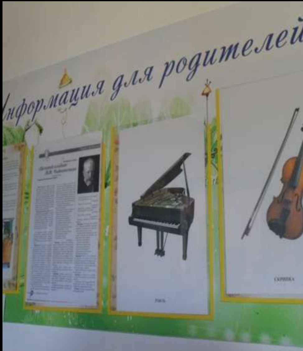
Среда для диалога с родителями