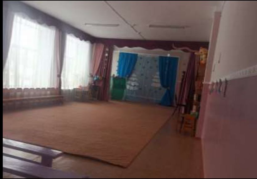
Верхняя правая точка

Вид Музыкального зала с четырёх точек по периметру