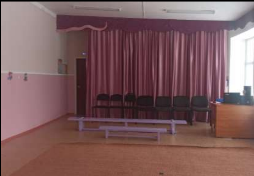
Вход в группу, нижняя левая точка

Вид Музыкального зала с четырёх точек по периметру