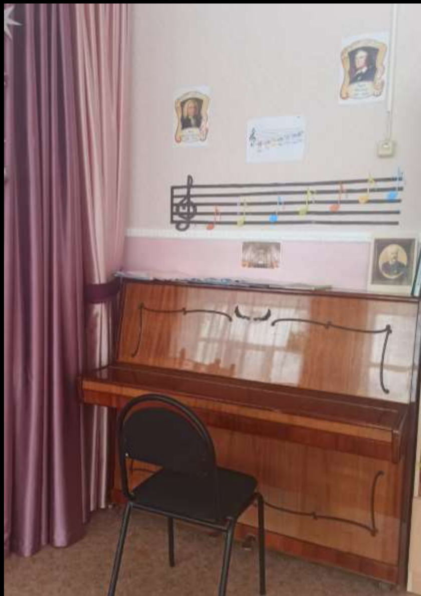
1.6. Рабочий сектор