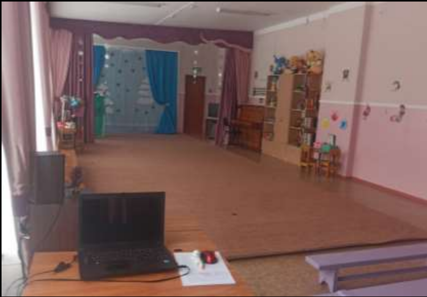
Верхняя левая точка