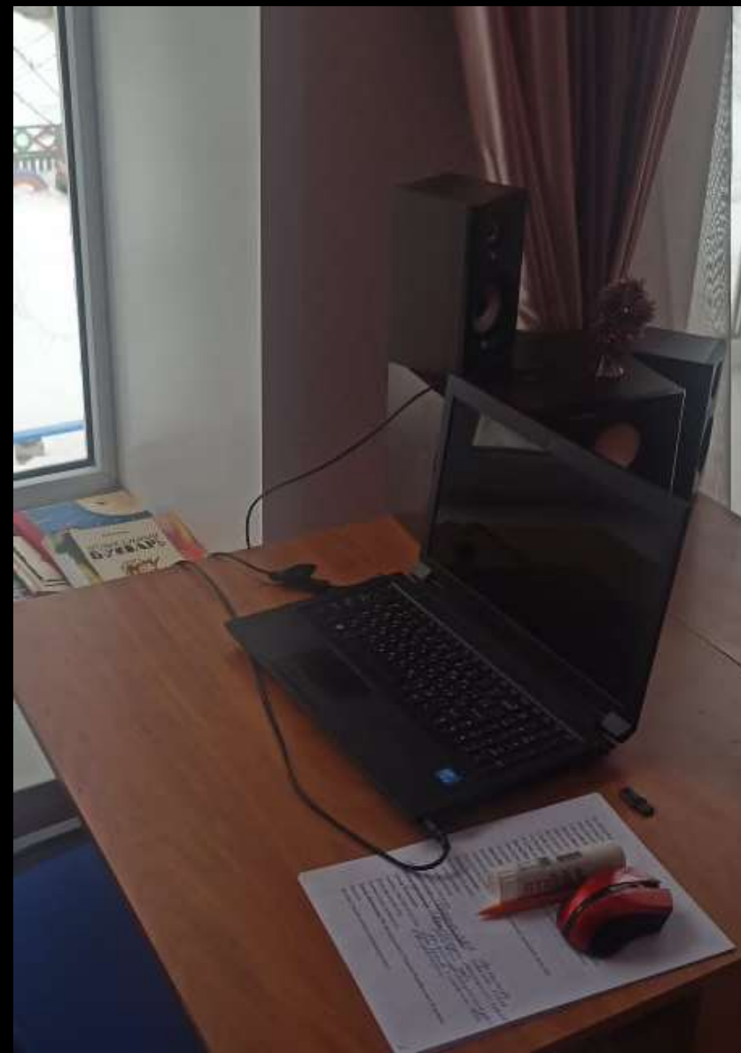
1.7. Рабочий сектор (ИКТ для педагога)