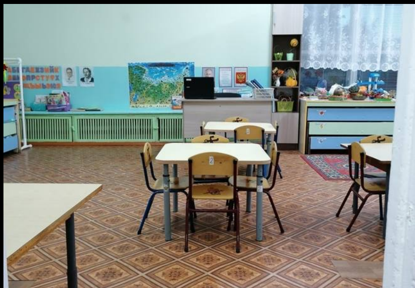
Вход в группу, нижняя левая точка