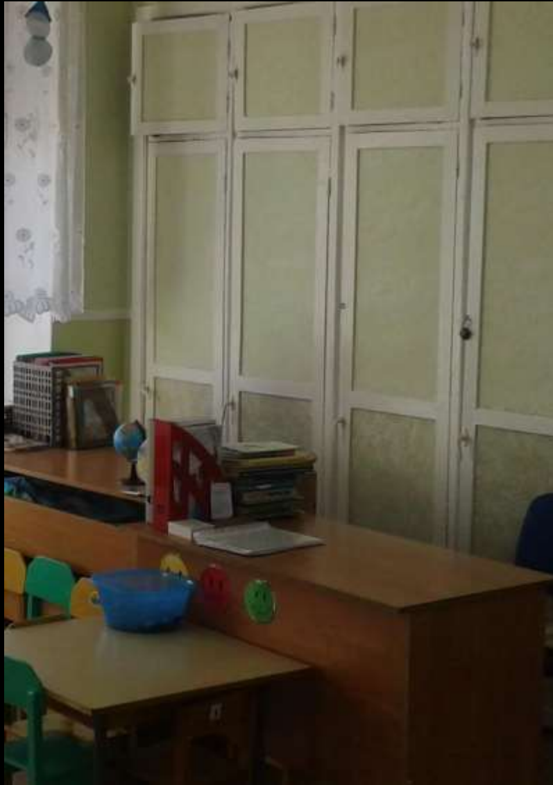
1.6. Рабочий сектор (методическая литература педагога)