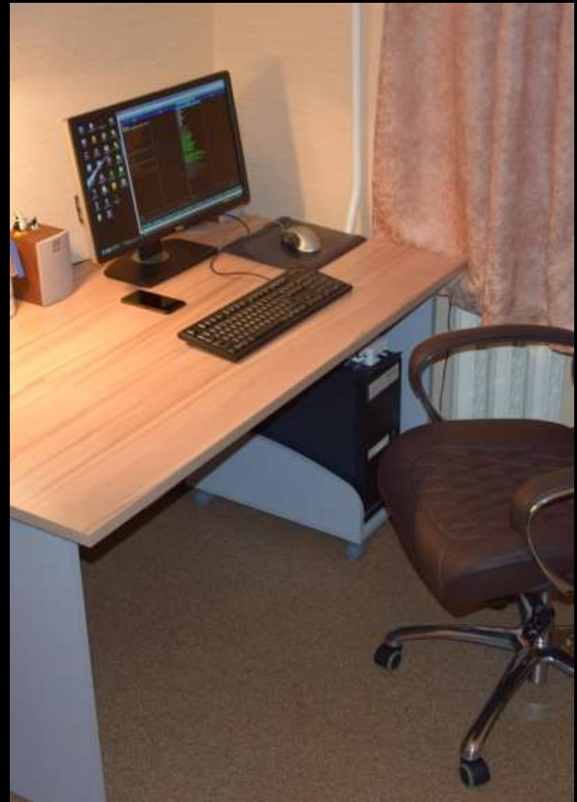
1.7. Рабочий сектор (ИКТ для педагога)