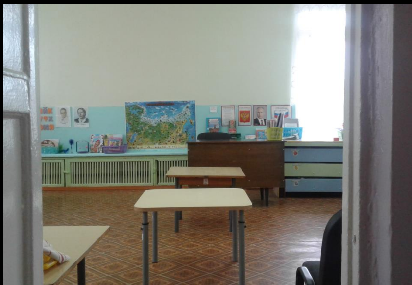
Вход в группу, нижняя левая точка