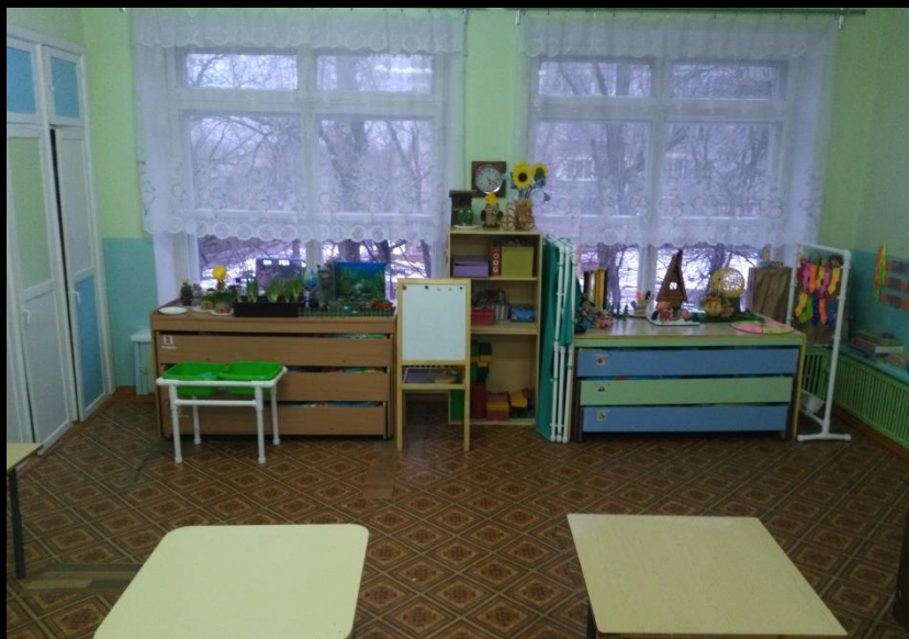
Нижняя правая точка