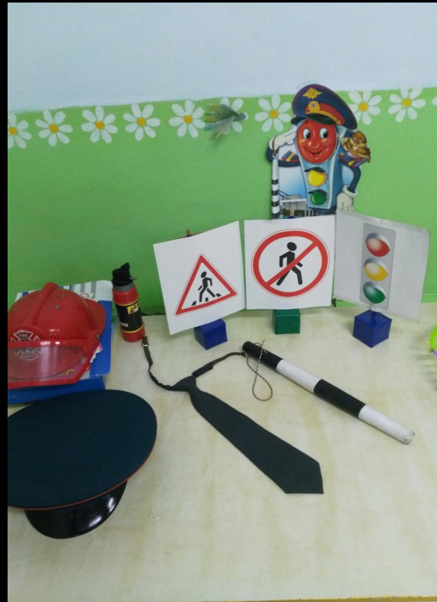
2.2.5. Активный сектор