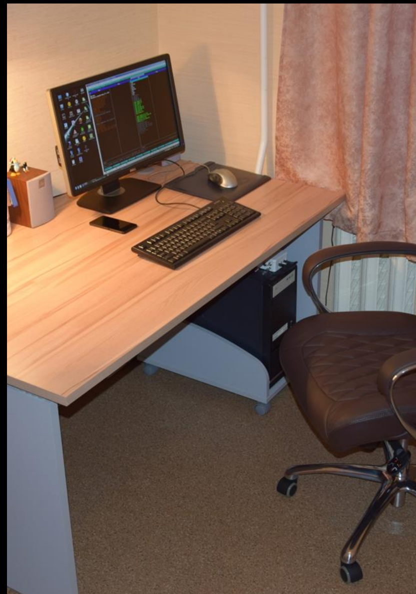
1.7. Рабочий сектор (ИКТ для педагога)