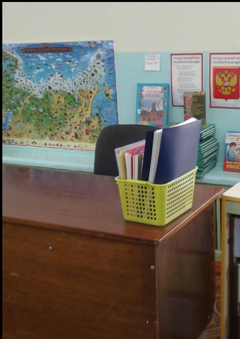
1.6. Рабочий сектор (методическая литература педагога)