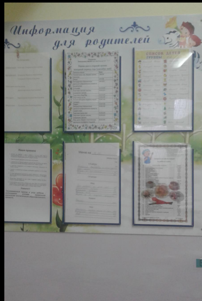
Среда для диалога с родителями