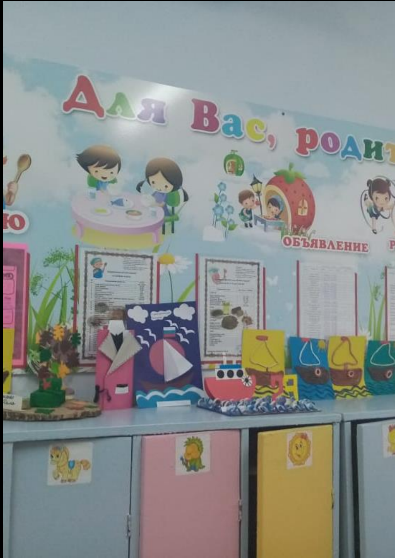
Среда для диалога с родителями