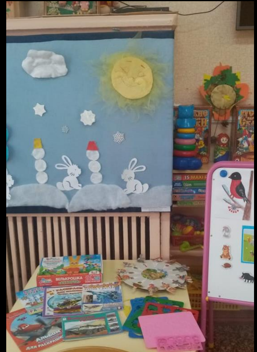
2.2.5. Активный сектор