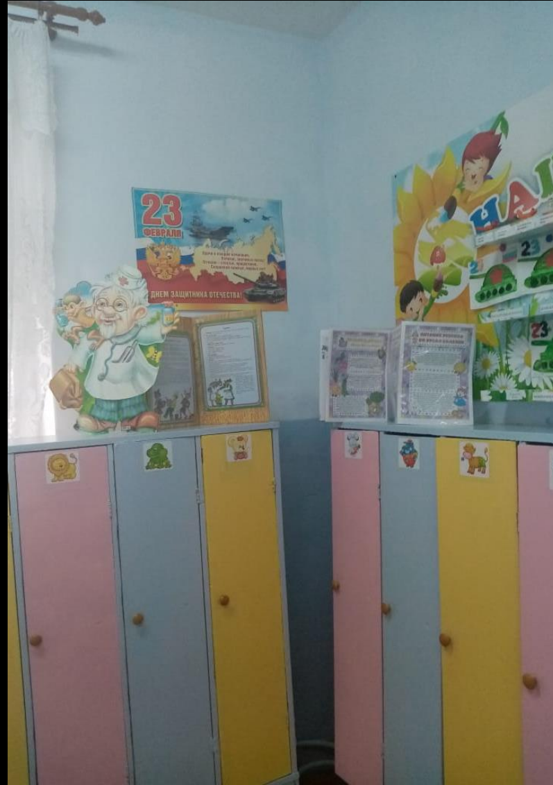
Среда для диалога с родителями