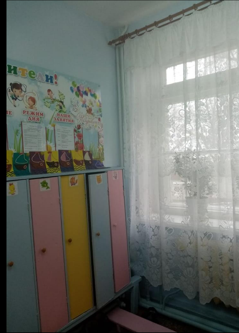
Среда для диалога с родителями