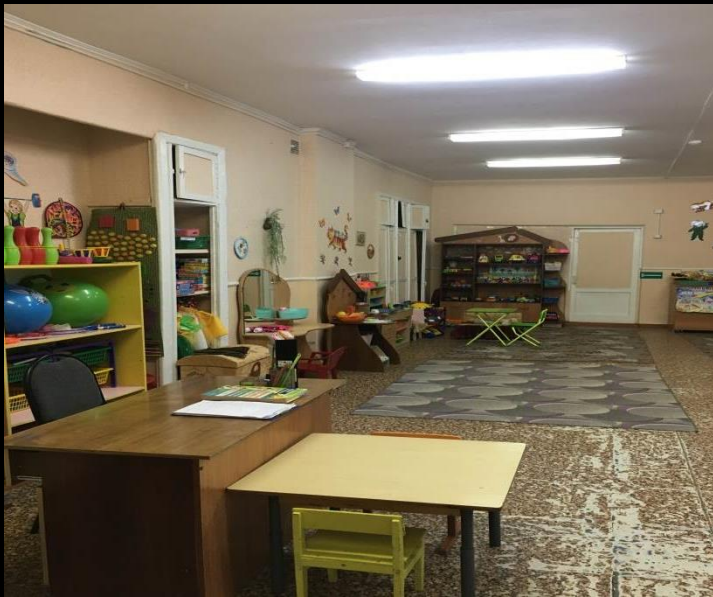
Вход в группу, нижняя левая точка