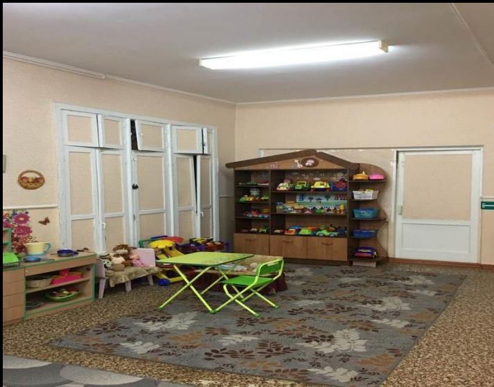
Верхняя левая точка