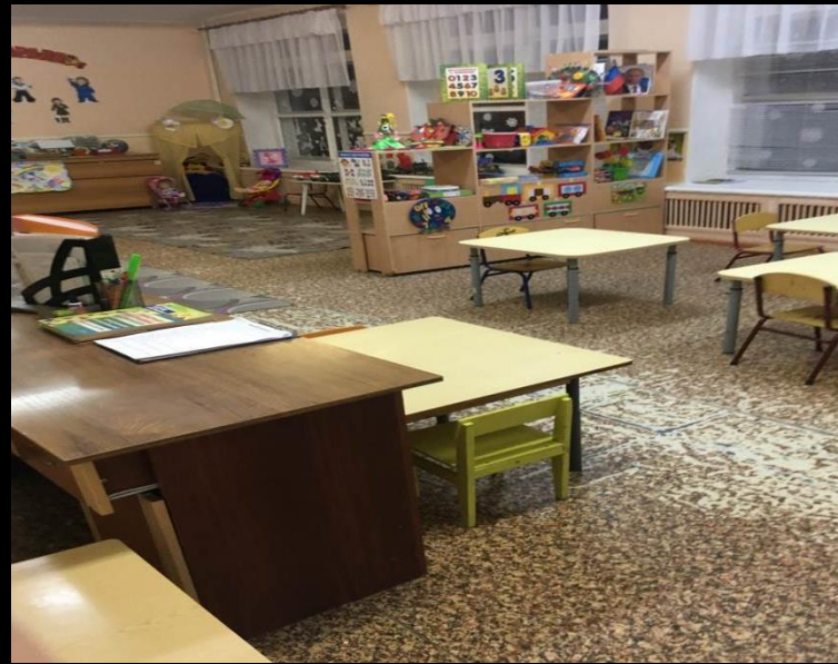
Нижняя правая точка