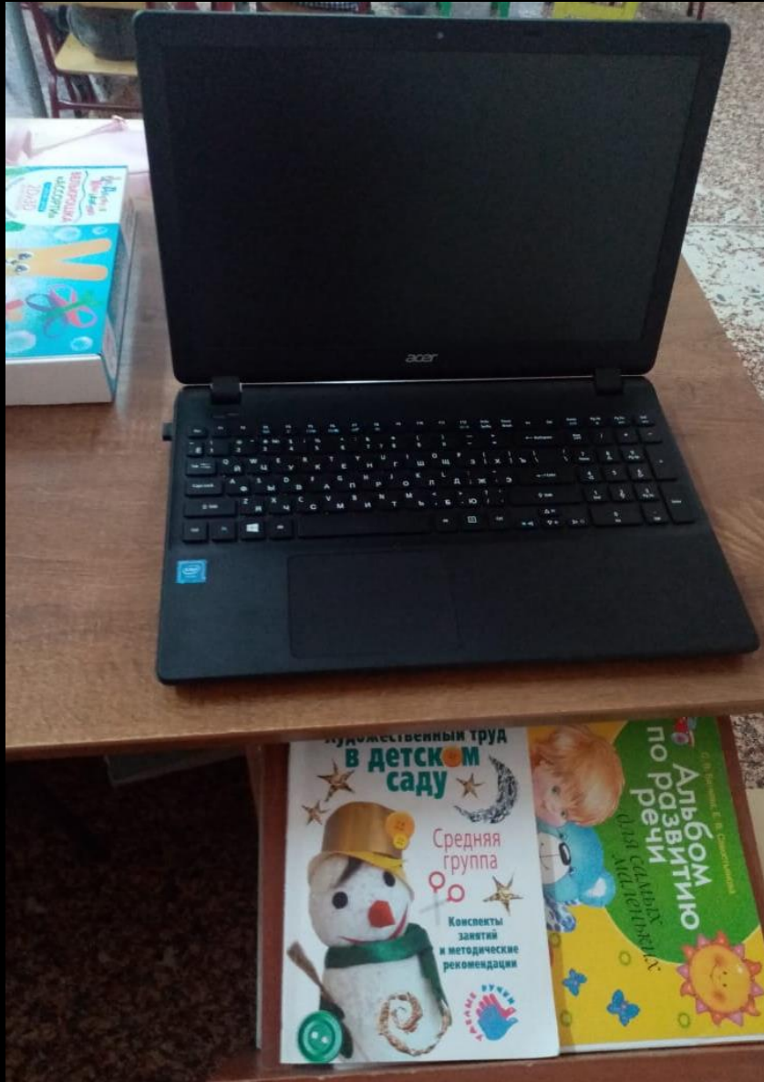
1.6. Рабочий сектор (методическая литература педагога)