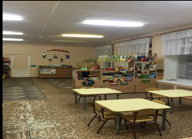
Верхняя правая точка